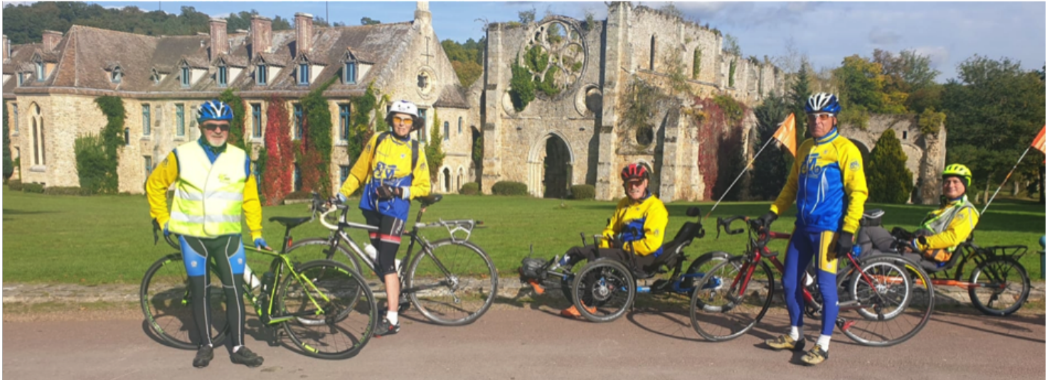
Ces merveilles à quelques kilomètres de Maurepas

Le Cyclotourisme Maurepas met à profit le bouleversement qui s'opère actuellement autour du vélo, pour accueillir le plus grand nombre de pratiquants. Un groupe VPT (Vélo Pour Tous) commence à se structurer pour le plus grand bonheur d'accidentés de la vie, qui retrouve le sourire en s'évadant avec le concours d'accompagnateurs indispensables pour assurer la sécurité.