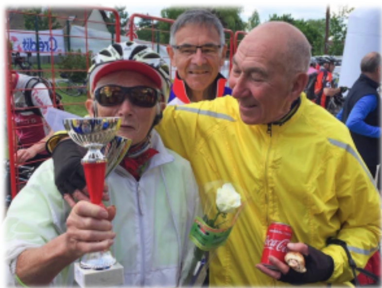
Dans son regard ....de la tendresse