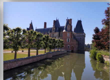
Le Gravel pour Philippe, passionné de cyclotourisme et de photographies

Après un peu plus de mille kilomètres parcourus avec ce vélo, j'ai trouvé celui qui me convenait, le mono plateau de 42 dents me va très bien, les gros pneus ne sont pas gênants et d'un confort digne d'un Pullman. J'ai monté quelques côtes comme celles de