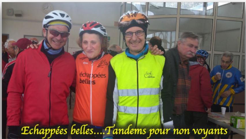
Echappées belles... Tandems pour non voyants

Un accueil chaleureux par Madly, Jean-Louis, Jean et tous les bénévoles nous a réconfortées, après les efforts de la matinée car le parcours n'est pas ce qu'il y a de plus plat. De plus nous avons été confrontées à un vent incessant. Nous avons apprécié les produits locaux et bio proposés au ravitaillement. Nous aurions bien pris une bière bio pour tester, mais nous sommes restées raisonnables en goûtant le jus de pomme bio, un vrai régal.