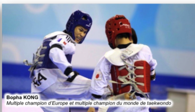
Bopha KONG Multiple champion d'Europe et multiple champion du monde de taekwondo

Depuis la retransmission TV des jeux paralympiques de Londres en 2012, le regard porté sur le handicap a évolué. Le sport contribue à prendre conscience que nous avons affaire, dans les différentes disciplines, à des athlètes de très haut niveau. Ils compensent certaines déficiences physiques par un mental hors normes, et sur ce plan les handicapés ont beaucoup à apporter au monde des valides.