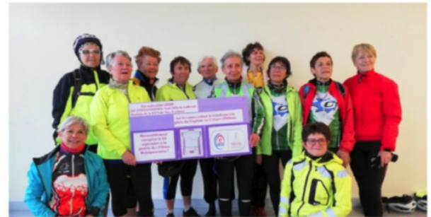
Quelques Yvelinoises en partance pour H&V