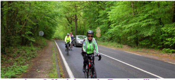
Les 3 féminines de Rambouillet